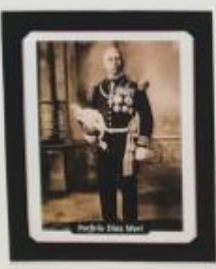
Pedro Pablo Kuczynski