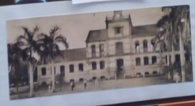
Troncal Escuela Central Escuela Central de Troncal de la Península de Yucatán, con protección internacional de la UNESCO de tipo "Biosfera". Escuela Central de Troncal de la Península de Yucatán del estado de Tabasco de México.