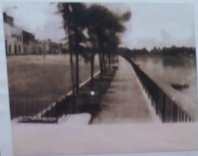
Troncal El Halcón Reserva de Biosfera de la península de Yucatán, con protección internacional de la UNESCO de tipo "Biosfera". Reserva de Biosfera "Troncal El Halcón" del estado de Tabasco de México.